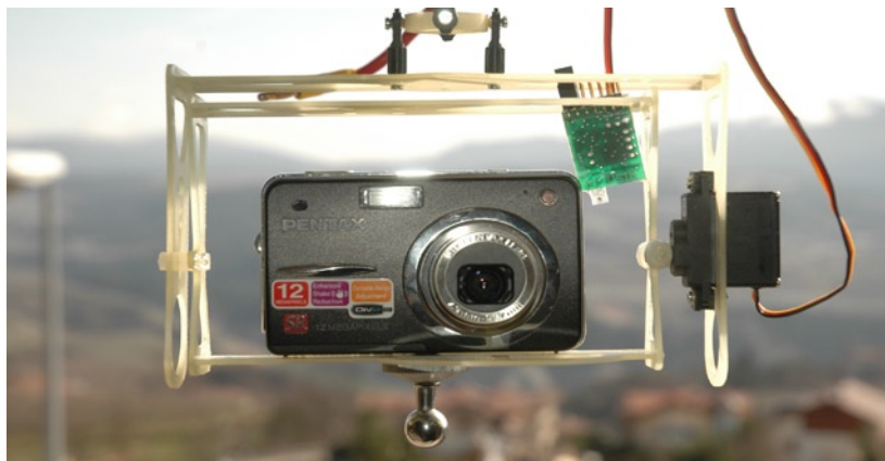
Fig. 4 – Il dispositivo di telerilevamento.

di orientare la camera sull'asse z , mentre per l'asse x e y si può sfruttare la rotazione del velivolo (Fig. 4).