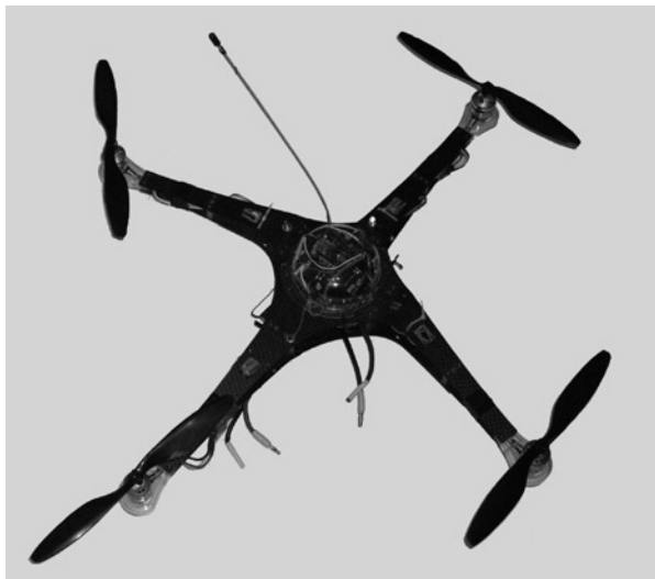
Fig. 1 – Il prototipo UAVP.