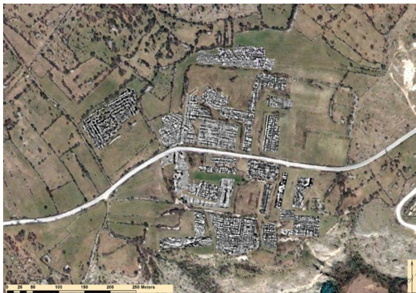
Fig. 1 – Indagini geofisiche nel castrum romano di Burnum (a cura di F. Boschi, con la partecipazione di Geocarta©, Paris; elaborazione GIS M. Silani).

e il restauro delle strutture antiche. L'area archeologica sorge all'interno del Parco Nazionale della Krka, nell'entroterra di Sebenico, dove si trovano i resti dell'antico municipio (II-VI d.C.) sviluppatosi sull'antico castrum romano (I a.C.-I d.C.), posto a controllo della frontiera tra Liburni e Dalmati, segnata appunto dal corso incassato del fiume Krka. Tutta l'area urbana antica è stata analizzata attraverso una lettura integrata delle immagini satellitari (anche multispettrali), delle fotografie aeree e da aquilone, dei rilievi geofisici (gradiometrici, elettro-magnetici, georadar) (Fig. 1). Inoltre sono stati effettuati rilievi analitici del suolo con tecnica GPS e delle strutture conservate in elevato sia con metodo fotogrammetrico, sia con scansioni laser. Quest'ultimo lavoro aveva anche lo scopo di monitorare lo stato del degrado e di indirizzare l'intervento di conservazione, che abbiamo realizzato in accordo con i colleghi croati. Scopo principale del progetto, infatti, era soprattutto studiare la genesi e lo sviluppo urbano di questo importante centro della Dalmazia, anche con il fine esplicito di favorirne la conservazione e la valorizzazione a scopo turistico. Il progetto, ormai pressoché concluso per ciò che riguarda l'acquisizione dei dati sul campo, è attualmente in fase di rielaborazione definitiva in vista della pubblicazione (GIORGI 2009, 517-550; GIORGI, BOSCHI, SILANI 2010; BOSCHI 2011; BOSCHI, GIORGI 2012).