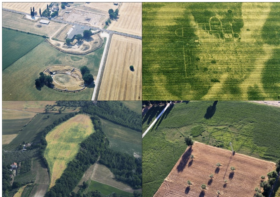
Fig. 4 – Alcune delle fotografie acquisite durante le ricognizioni aeree, per scopi esplorativi, di documentazione e monitoraggio. a) Panoramica dell'area urbana di Suasa : fra l'anfiteatro e la domus dei Coiedii , le tracce nell'erba medica rivelano il teatro sepolto; b) Edificio suburbano nell'area di Suasa , scoperto grazie alle immagini aeree; c) Panoramica del pianoro sommitale di Miralbello (nel territorio di San Lorenzo in Campo, sulla sponda opposta del Cesano rispetto a Suasa ). Si osservano cropmark riferibili a fossati sub-circolari; d) Cropmark in erba medica che rivelano un edificio sepolto nella zona extra urbana di Suasa.

ricerche. Le immagini raccolte nella Fig. 4 (Tav. XI, b) sono soltanto una limitata selezione degli scatti finora acquisiti, ma dimostrano le potenzialità dell'applicazione del metodo al contesto di indagine, per la sua complessità, per la buona leggibilità di molti dei suoi terreni, e per il suo spessore storico e archeologico.